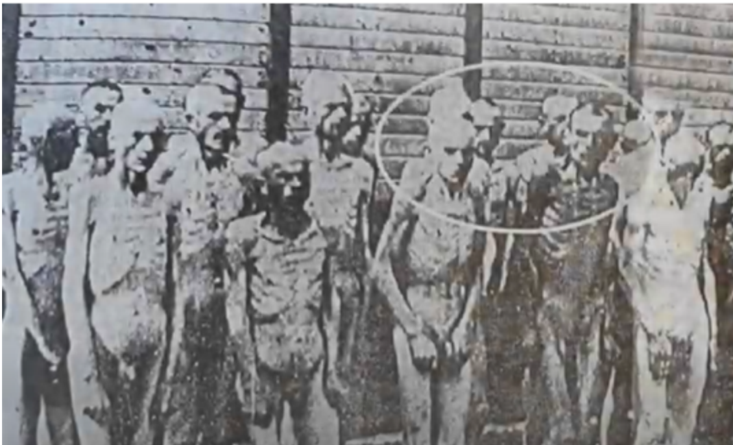
(Foto e të burgosurve në kampin e përqëndrimit) (Pjesë e dokumentarit "From hell to hell" Eva Kushova)