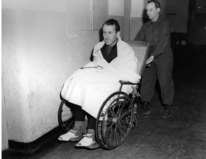
Kaltenbrunner-i në spitalin e Gjykatës së krimeve të Luftës, Nürenberg.

informoheshin nga njerëzit e besuar, pra agjentët, për aktivitetet politike të qytetarëve. Këto organe represive arritën që brenda një kohe të shkurtër të mbillnin psikozën e frikës dhe pasigurisë dhe të thyenin kësisoj qëndresën e brendshme të popullit gjerman.